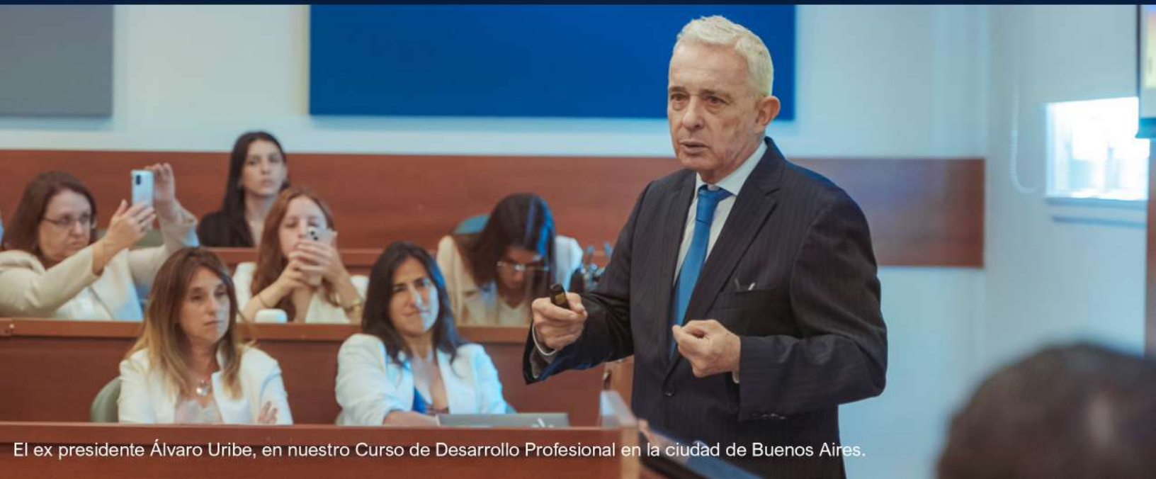
El ex presidente Álvaro Uribe, en nuestro Curso de Desarrollo Profesional en la ciudad de Buenos Aires.

Un liderazgo efectivo requiere dominar la comunicación estratégica para influir, persuadir y conectar con diversos públicos. Esto implica la construcción de mensajes de alto impacto, el manejo de la opinión pública, el uso inteligente de medios y plataformas digitales, y el desarrollo de habilidades de negociación y diplomacia.