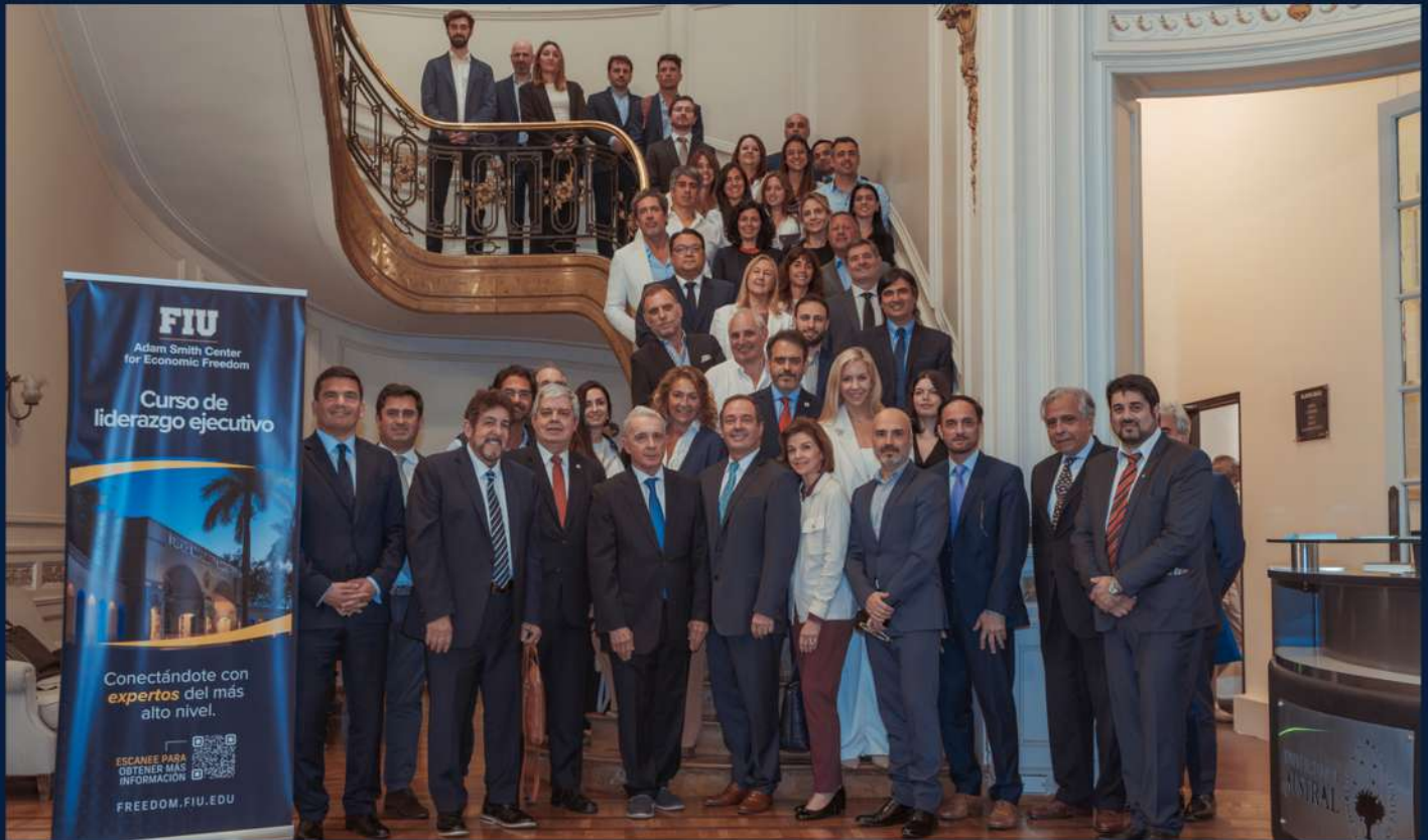
Participantes Curso de Desarrollo Profesional en Gestión de Crisis, Buenos Aires, 2024