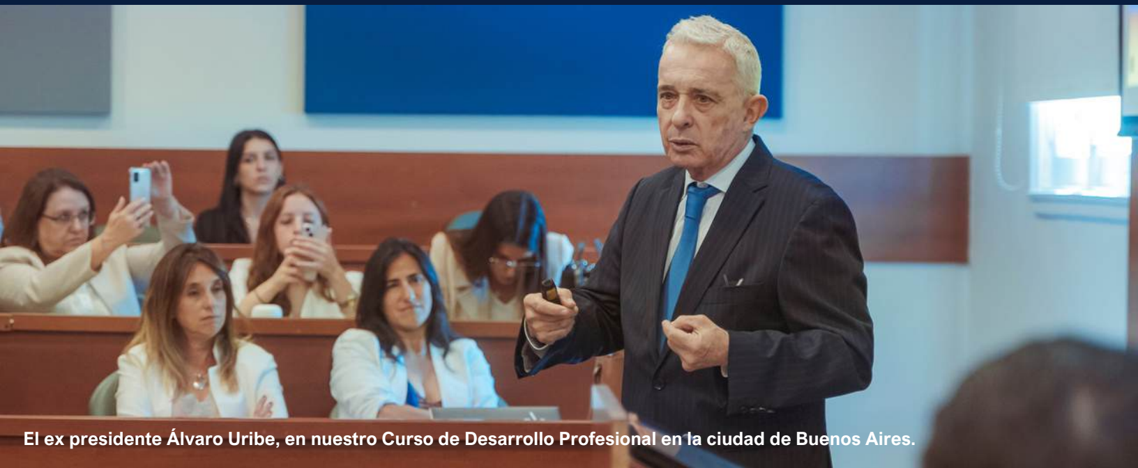
El ex presidente Álvaro Uribe, en nuestro Curso de Desarrollo Profesional en la ciudad de Buenos Aires.

En la era del algoritmo y el impacto digital, un líder político debe ser también un extraordinario comunicador. ¿Cómo construir o disputar las narrativas que moldean la opinión pública? Este curso se enfoca en la construcción de discursos poderosos que no solo informan, sino que generan adhesión y transformación. Se abordará el impacto de las redes sociales como herramientas de influencia masiva, la inmediatez como un arma de doble filo en la gestión de crisis y la importancia de construir mensajes que resuenen en una sociedad hiperconectada.