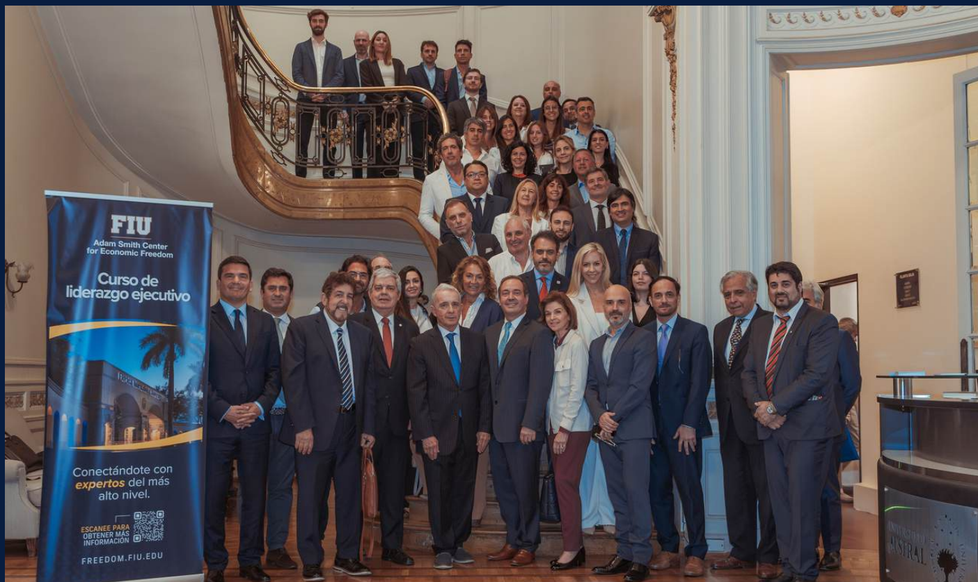
Participantes Curso de Desarrollo Profesional en Gestión de Crisis, Buenos Aires, 2024